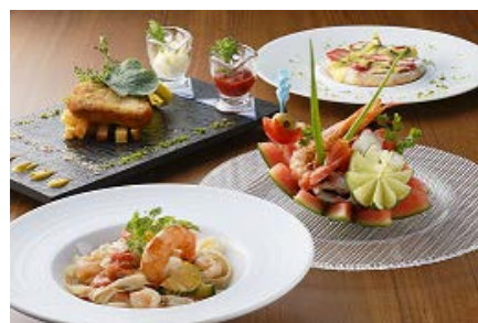
HAPPY BIRTHDAY Bel Lago