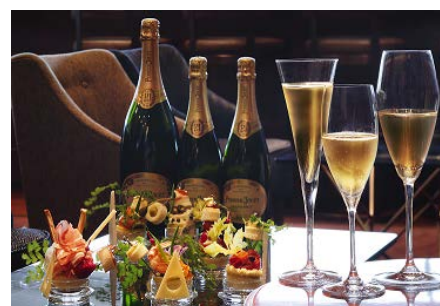
シャンパンフリーフローイメージ