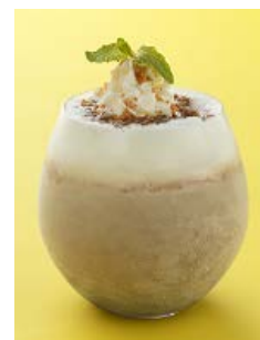
アイスクョコラータ