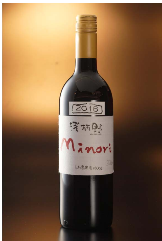
'16 浅柄野“Minori” イメージ