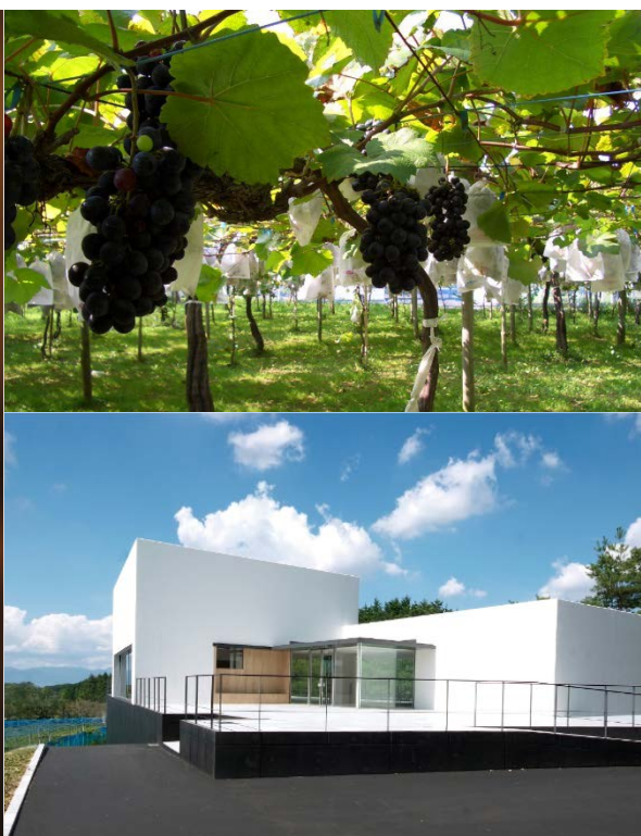
太田酒造・琵琶湖ワイナリー イメージ

本企画は、滋賀県内および比叡山の懐に位置する4つのホテルが、地域との関わりを通して滋賀県の魅力を発信することを目的として2008年にスタートし、本年で9回目を迎えます。ブドウ栽培に適した土壌づくりに取り組み、数々のワインを世に送り出してきた太田酒造株式会社(琵琶湖ワイナリー 所在地：滋賀県栗東市)が自社農園で育てたブドウを、4ホテルのソムリエがお客さまの嗜好や料理に合うブレンド比率を考え、毎年数量限定で販売を実施してきました。