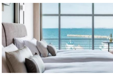
プレミア・ラグジュアリーフロア「Vista」 42～45㎡