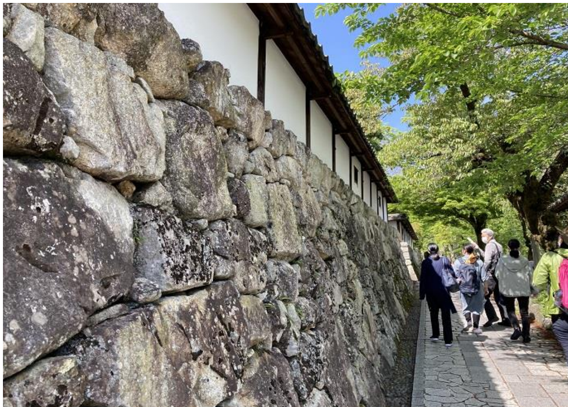
比叡山坂本エリアの街並み（イメージ）

「BIWAKO MY DESIGN TRIP～レイクリゾートで見つける、自分らしい旅のかたち～」をコンセプトにご提案する宿泊プランのうち、大津のまちあるきをテーマにした企画第4弾の本プランでは、自然石を巧みに積み上げた“穴太衆（あのうしゅう）積み”の石垣と、延暦寺の僧侶が里に設けた院や坊である“里坊”など、歴史的な街並みが美しい比叡山坂本エリアをホテルスタッフがご案内します。