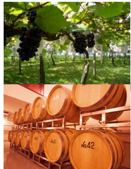
「2021 浅柄野 Minori」イメージ

本企画は、滋賀県内および比叡山の懐に位置する7つのホテルが、地域との関わりを通して滋賀県の新たな魅力を発信することを目的として2008年にスタートし、 本年度で14回目を迎えます 。ブドウ栽培に適した土壌づくりに取り組み、数々のワインを世に送り出してきた太田酒造株式会社 栗東ワイナリーが自社農園で育てたブドウでできたワインを、各ホテルのソムリエが集まり、お客さまの嗜好や料理に合うようブレンドを重ねたオリジナルワインです。滋賀の土地で育ったブドウでつくったワインを、地域のホテルで提供される和洋中さまざまな料理とともに楽しむことで、滋賀の食の豊かさに触れていただくきっかけになればと考えています。