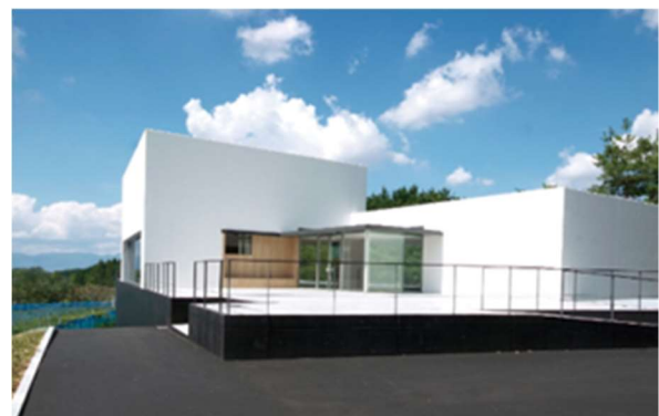
栗東ワイナリー外観