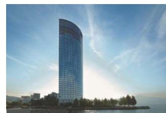
びわ湖大津プリンスホテル