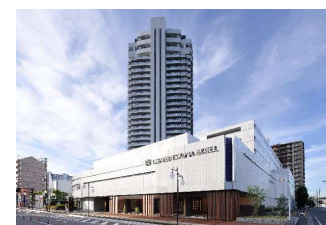
クサツエストピアホテル