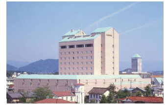
ホテルニューオウミ