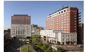
ホテルポストプラザ草津