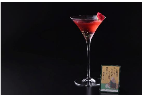
三室龍田川 (イメージ)

「 嵐吹く 三室の山の もみぢ葉は 龍田の川の 錦なりけり 」 【歌番号 69 能因法師】 『山風が吹き散らした三室山の紅葉は、龍田川に流れ入り、水面が錦のように絢爛たる美しさだ。』 古来から紅葉の名所として知られる龍田川に散りかかる紅葉の絢爛な美しさを赤や金の華やかな色彩でグラスに表現。桃や青りんごリキュールの華やかな香りと甘い風味が広がります。