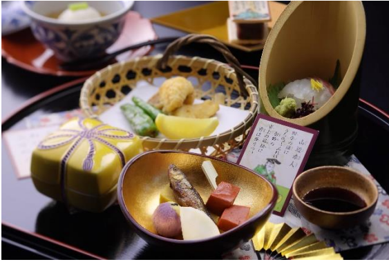
百人一首ランチ 冬の宴 (イメージ)

今回は、山部赤人の歌「 田子の浦に うち出でてみれば 白妙の 富士の高嶺に雪は降りつつ 」にちなみ、赤と白をイメージカラーとして、もろこ甘露煮や赤蒟蒻煮といった郷土料理をお楽しみいただけます。寒さが深まるにつれて甘みが増す蕪で作られる千枚蕪酢漬は、この時期ならではの。揚物は“鮫鯨（あんこう）”を唐揚げでお召し上がりいただけます。そのほか、優しい味わいの百合根饅頭もご賞味ください。