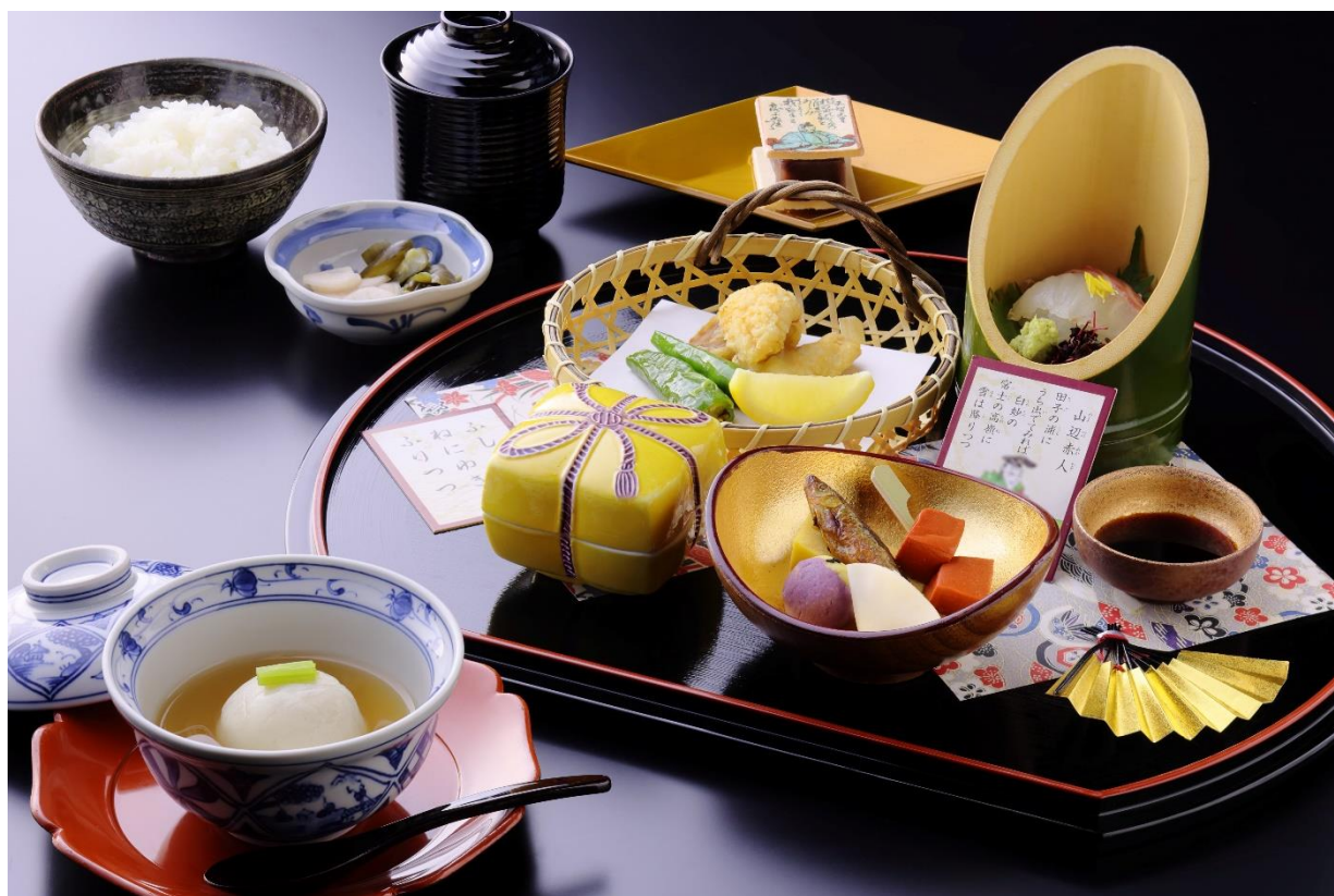
「日本料理 おおみ」百人一首ランチ 冬の宴（イメージ）