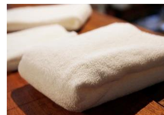
IKEUCHI ORGANIC のタオル

お客様の肌に直接触れるものなので、安全性と心地よさにこだわった完全オーガニックの今治タオルの名店「IKEUCHI ORGANIC」のバスタオル、フェイスタオル、ハンドタオル、バスマットを導入。