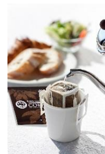
「バードフレンドリー®認証」のオーガニックコーヒー

客室での寛ぎの時をご提供したく、客室のお飲み物として、京都発祥の小川珈琲から「バードフレンドリー® プログラム」にも認証されている、 オーガニックコーヒーを取り入れました。