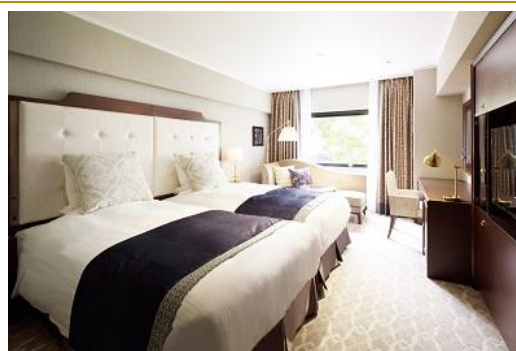
▲グランコンフォートルーム

2015年9月18日(金)に「グランコンフォートルーム」87室、「ガーデンスイート」1室、「ガーデンジュニアスイート」1室をリニューアルオープンいたしました。古都京都の今を体感する「ノスタルジックモダン」をテーマとし、こだわりの水周り設備とベッド、オーガニックアメニティを備えた上質な空間を実現。