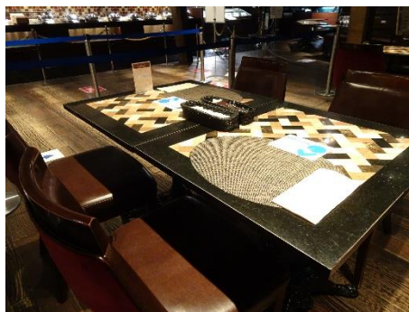
テーブル同士の距離の確保に加え対面での着席を極力避けるようセッティング