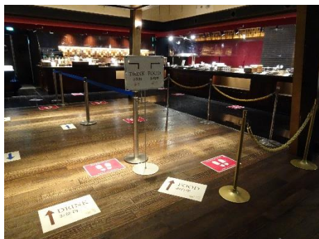
料理台での密を避けることを目的とした案内版の設置・床シールの貼付

感染症のリスクを減らすため、ビュッフェトングを最低30分に1回新しいものに交換いたします。