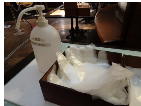
消毒液・ビニール手袋の設置