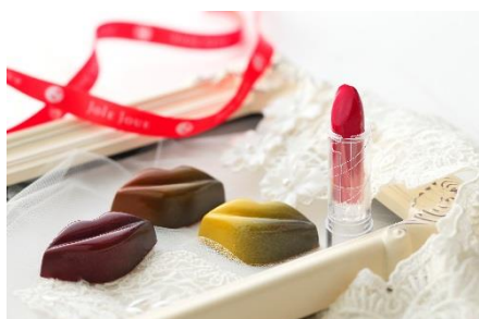
リップル&amp;アンジーショコラ