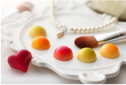
スイートチークス