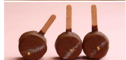
キャンディーギモーヴ (上: フランボワーズ 下: ミルク)