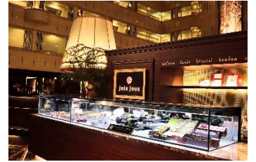
スイーツティック ジョアージュ