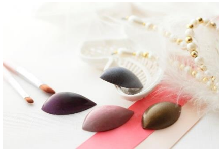
グロッシェアイズ

ほんわりと色づくチークをイメージしたカラフルでキュートなショコラ。口だけの良いホワイトチョコレートのガナッシュとそれぞれのフレーバーのジュレをホワイトチョコレートでコーティングしました。