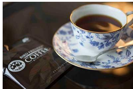
▲小川珈琲の「バードフレンドリー®認証」のオーガニックコーヒー