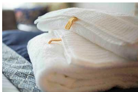
▲「IKEUCHI ORGANIC」のオーガニックコットンタオル

客室での寛ぎの時をご提供したく、客室のお飲み物として、京都発祥の「小川珈琲」から「バードフレンドリー® プログラム」にも認証されている、オーガニックコーヒーを取り入れました。