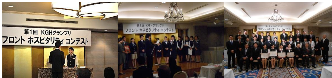
【上記写真：過去実施したコンテストの様子】

京阪グループホテル4社（株式会社ホテル京阪、京都タワー株式会社、株式会社琵琶湖ホテル、株式会社京都センチュリーホテル）と株式会社プリンスホテルでは、各ホテルのフロントスタッフによる「フロントホスピタリティコンテスト」を2016年6月7日（火）に初めて共同開催いたします。昨年までは京阪グループホテルの4社12ホテルで開催し研鑽を続けてまいりましたが、第4回目の開催では、より多くの旅行者の満足度向上を目指し、今回初めてプリンスホテルの運営するグランドプリンスホテル京都、びわ湖大津プリンスホテルを加え5社13ホテルで開催いたします。近年、訪日外国人客やアクティブシニアを含む3世代ファミリー、女性グループやおひとりさま旅行など旅行ニーズは多様化しています。そこで、常にサービスの最前線でお客様の様々なニーズにお応えしているフロントスタッフによるコンテストを実施し、日頃の対応をロールプレイングで演じ、競い合うことで接客スキルと「おもてなし」精神の向上を図ります。今後も共に連携し、地域の魅力と旅行者の拡大、ご満足いただけるホスピタリティ向上を目指してまいります。