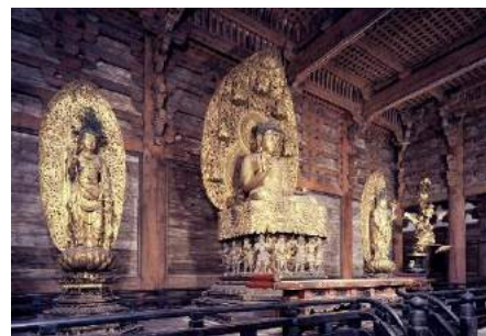
◎東寺 金堂内薬師三尊・十二神将

文明18年(1486年)に焼失。現在のものは豊臣秀頼が発願し、再興。慶長8年(1603年)に竣工。豪華雄大な気風みなぎる桃山時代の代表的建築。重要文化財である薬師三尊(日光菩薩、月光菩薩、薬師如来)と、薬師如来の台座周囲に配された十二神将がある。