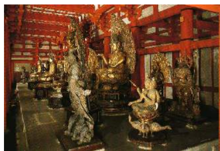
◎東寺 講堂内 立体曼荼羅

安置される二十一軀の仏像は立体曼荼羅として、弘法大師の密教の教えが表現されている。