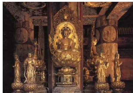
◎東寺 五重塔 心柱を囲む四仏坐像

天長3年(826年)弘法大師の創建着手にはじまる。雷火の焼失などにより、現在の塔は5代目。現在の塔は徳川家光の寄進によって竣工した総高54.8メートルの現存する日本の古塔の中で最も高い塔。細部の組もの手法は純和様を守る、江戸時代前期の秀作。