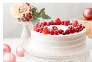
3. ガトー・フリュイ・ルージュ