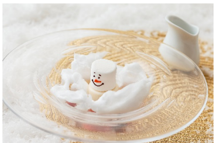
フォン・ドゥ・ネージュ

お席についたら、まずはパティシエからのおもてなしの一皿として、フランス語で“雪解け”を意味する「フォン・ドゥ・ネージュ」をご提供いたします。