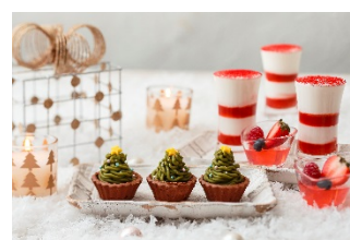
5. ベリーティラミス 6. モミの木モンブラン