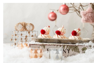
12. ムラング・シャンティー

※表示料金にサービス料 10%と消費税が別途かかります。 ※メニュー内容および食材の産地等は仕入れの都合により変更になる場合がございます。 ※写真は全てイメージです。