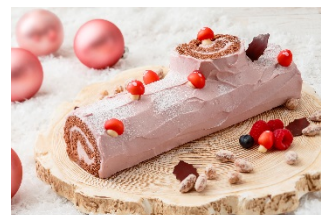
8. プッシュ・ド・ノエル