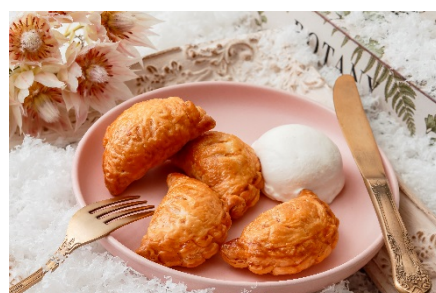
出来立てをご提供！ショーソン・オ・ポンム