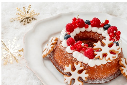
ガトー・ショコラブラン

パイ生地にリンゴのコンフィチュールを包んで焼き上げた“ショーソン・オ・ポンム”は、出来立てをご提供。アツアツのパイに15種類以上あるアイスクリームをあわせてお楽しみいただくのもおすすめです。