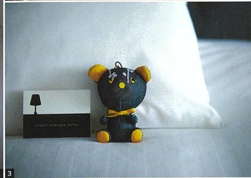
1) 靴を脱いで寛げるように床座を取り入れ、日本らしい落ち着いた空間の「京プレミアム」。2) 吹き抜けが広がる「オールデイダイニングラジオウ」では、季節を感じられるbuffetが楽しめる。3) 京都デニムとのコラボにより誕生した、リユースジーンズ生地を一部に用いたホテルオリジナルティディベア