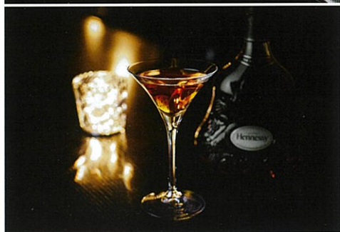
新設した特別客室のゲストだけが楽しめる朝食とバーのフリーフロー

上・下) 厚切りトーストや目玉焼きなど喫茶店を想像させる朝食と、豊富な品種を取り揃えるバー「ESSEX」のフリーフローは、どちらも特別客室に宿泊したゲストだけが楽しめる特典