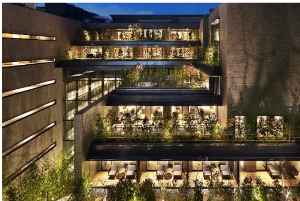
◆豊かな緑と心地よい秩序性を持つ建築とランドスケープが生み出す様式美。現代の「市中の山居」を表現。

「THE THOUSAND KYOTO」は、京都の豊かな知恵に触れる“パーソナル・コンフォート・ホテル”をコンセプトに、単なる高級ではなく高品質なセンスと、京都・日本の知恵を活かした心地よさを提供しています。「THE THOUSAND KYOTO」ならではの特別な京都体験コンテンツもあり、今回の加盟を機に世界中に京都・日本の魅力を発信するグローバルホテルとして、一層の飛躍を目指します。