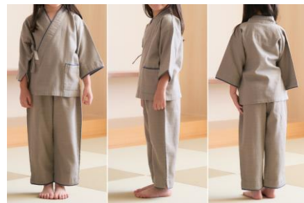
※モデル 年齢：5歳、身長：115cm