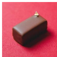
ほうじ茶とキャラメル