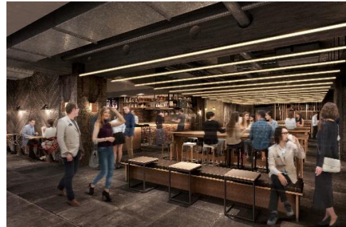
▲地下1階イメージパース

「京都を味わう食べ歩きが楽しいフードホール」をテーマに、地元の名店から話題の人気店までを揃えた、京都の食を堪能できる飲食フロアです。19店舗が出店し、店内カウンターを含め約400席を用意しました。フロア内は自由に飲食可能で、観光客はもちろん、深夜23時までの営業時間のため、仕事帰りの一杯等にも気軽に利用できます。