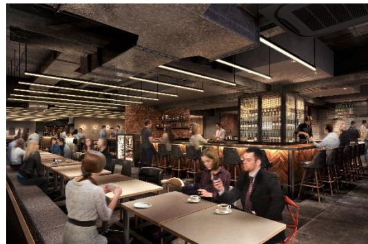
▲「KYOTO TOWER SANDO（京都タワー サンド）」完成イメージ