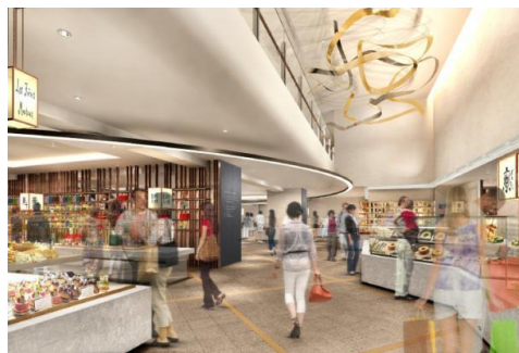
▲ 1階イメージパース

「京都らしい逸品が集まるマーケット」をテーマに、京都の和洋菓子から漬物、コスメ、カフェなど、京都好きの大人の女性にご満足いただけるこだわりの逸品を提供する31店舗が出店します。