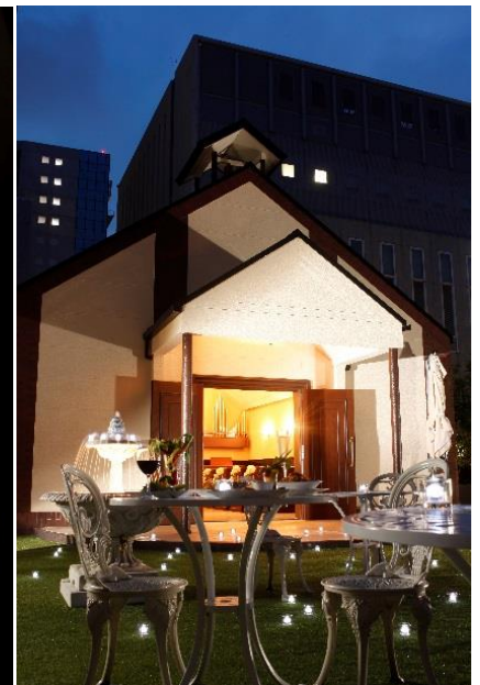
京都センチュリーホテル「星空テラス～Cafe & Bar～」

チャペル前に広がるガーデン空間で、マーズ(火星)・ジュピター(木星)・ヴィーナス(金星)などの惑星をイメージした、「惑星カクテル」が愉しめる「星空テラス～Cafe & Bar～」。 星空を眺めるビアガーデンとしても、女性を中心に大好評をいただいている本企画にて、7月1日(土)より京都タワーホテル、琵琶湖ホテルとコラボレーションし、七夕をイメージしたオリジナルカクテルをご提供いたします。 京都センチュリーホテルは織姫と彦星の間を流れるミルキーウェイ(天の川)、京都タワーホテル「スカイラウンジ『空』-KUU-」はベガ(織姫)、琵琶湖ホテル「ルーフトップテラス」はアルタイル(彦星)を表現した幻想的なオリジナルカクテルをご用意。 さらに、7月7日(金)七夕当日限定で、各ホテルにて3種全てのカクテルをお楽しみいただけます。