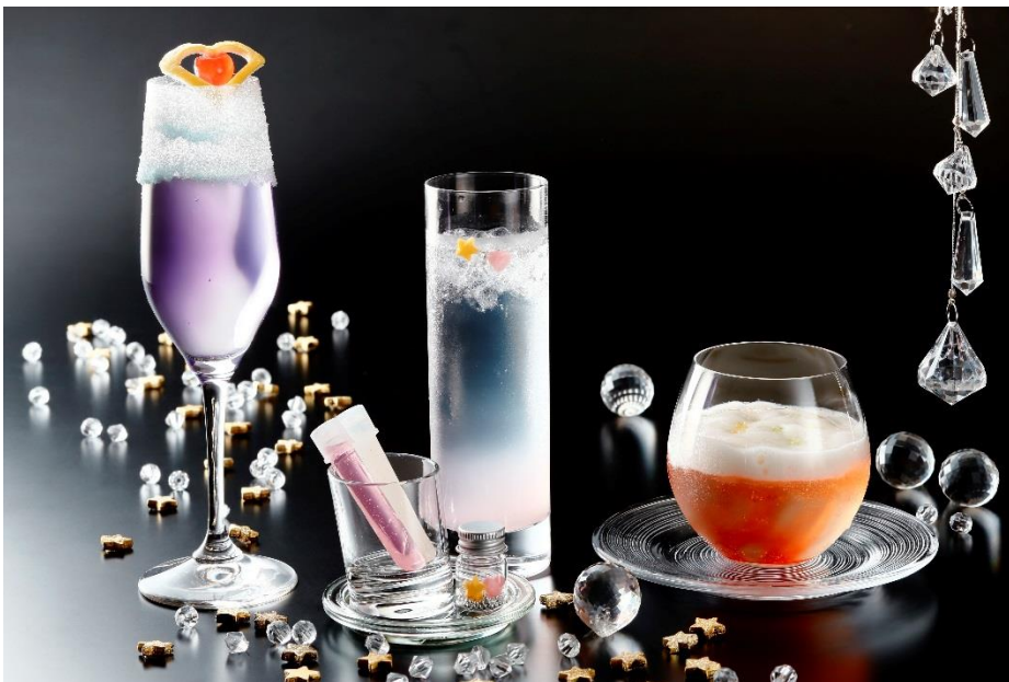
左から、ベガ～織姫～、ミルキーウェイ～天の川～、アルタイル～彦星～

京都センチュリーホテル・京都タワーホテル・琵琶湖ホテルがコラボレーション 七夕をイメージしたオリジナルカクテルが新登場