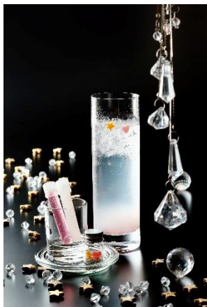
ミルキーウェイ～天の川～

ベガ(織姫)とアルタイル(彦星)の間を流れる“ミルキーウェイ(天の川)”。小さな試験管の中には、それぞれローズとカルピスのシロップが入っており、グラスの中に注ぎ入れると、上から下へと揺らめき流れ落ちることで、天の川を表現。小瓶の中には、天の川の周りに輝く星々をイメージしたアラザンシュガーと織姫に見立てたハート型のチョコレート、彦星に見立てた星型のチョコレートが。最後にグラスに注いでいただくことで、七夕の日に天の川で再会を果たす2人を表しました。