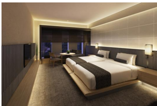
スタンダードツイン