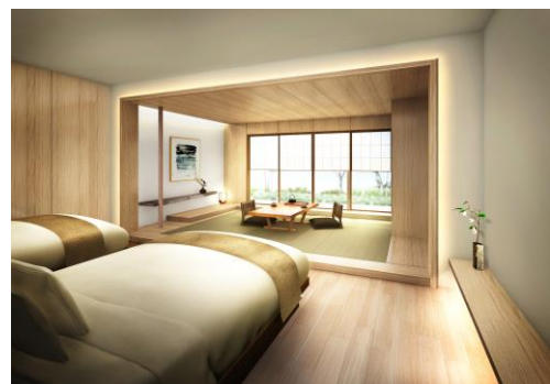
ガーデンスイート