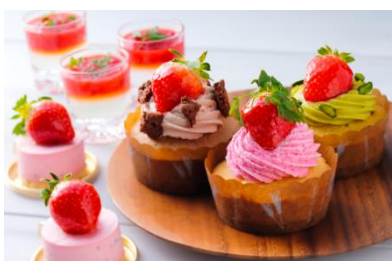
見た目もかわいらしいカップケーキは、 バニラ・シヨコラ・ピスタチオをご用意。