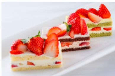
定番のショートケーキは生クリームや、 トンカ豆シヨコラ、わさびクリームをご用意。

いちごショートケーキやいちごタルトの他、ロールケーキやカップケーキ、サンドイッチ等、いちごの品種にあわせて、食材を使い分けることで、品種の異なるいちごの食べくらべと、いちごと食材の組み合わせをおたのしみいただけます。