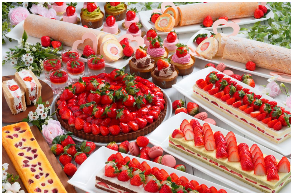
ストロベリーフェア ～いちごめぐり～ イメージ

琵琶湖ホテル（所在地：滋賀県大津市浜町、総支配人：荒木昌志）は、2018年1月15日(月)から5月6日(日)までの期間、2階「イタリアンダイニング ベルラゴ」にて、「ストロベリーフェア～いちごめぐり～」を開催します。