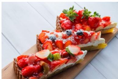
いちごタルトは、王道のアーモンドクリームの 他、バジルやリュバープを使ったタルトも登場。