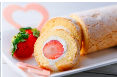
ロールケーキは、生クリームの他、人參の ビスキュイとほうれん草クリーム等もご用意。