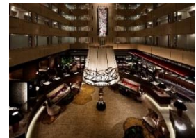
数々の空間アワードを受賞した「オールデイダイニング ラジョウ」

【URL】 https://www.keihanhotels-resorts.co.jp/kyoto-centuryhotel/lajyho_summer_party/index.html