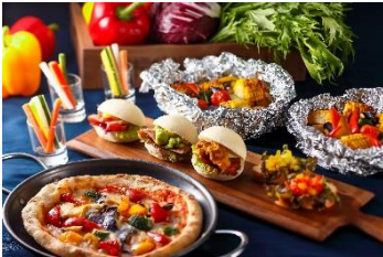
丹後産食材使用のメニュー例

現在「Summer Garden Party at La Jyho」をテーマに開催中のランチ・ディナービュッフェにて、京都・丹後産食材を使ったメニューの提供や、海の京都の観光情報の発信などを実施。8月31日(金)まで。