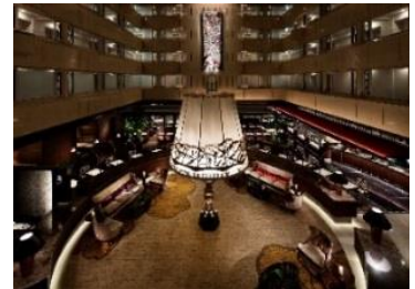
京都センチュリーホテル 2階ロビー