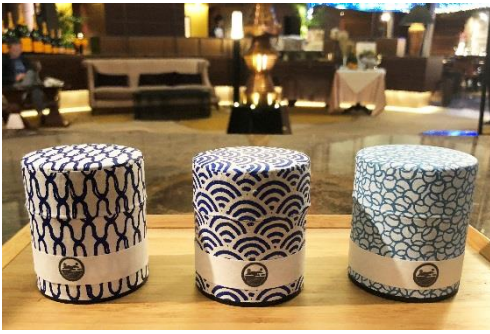
「海の京都」をイメージした京染和紙