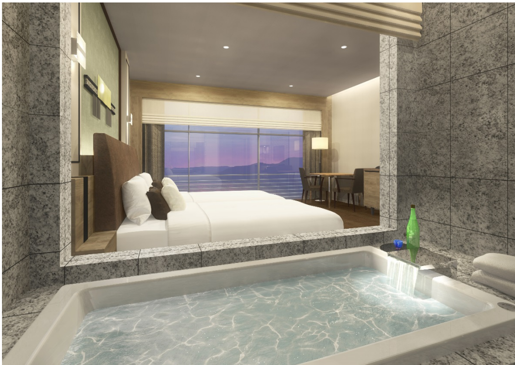
プレミア・ラグジュアリーフロア Vista

琵琶湖ホテル（所在地：滋賀県大津市浜町、総支配人：大塚滋）は、客室改装計画 第四期として4階の一部をプレミア・ラグジュアリーフロア「Vista（ビスタ）」に改装し、2019年3月30日（土）より販売いたします。