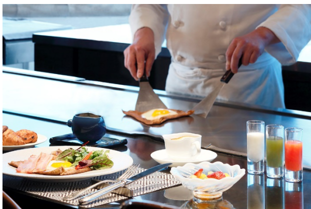
Vista 専用朝食“鉄板シェフズテーブル”