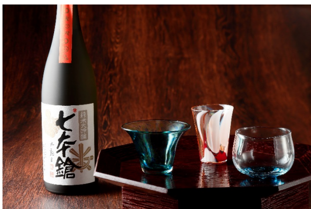
四季折々の地酒と地元の酒器

Local Experience を感じながら、旅の疲れがほっくりと癒されるひとときをどうぞ。