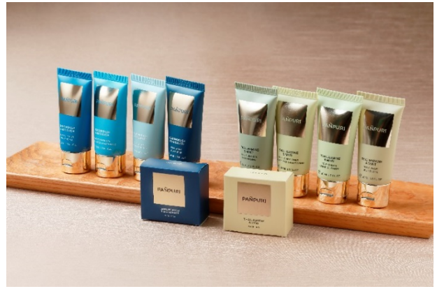
専用アメニティ～PAMPURI（パンピューリ）～