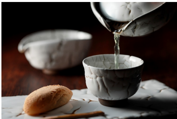
プライベートチェックイン&ウエルカムドリンク