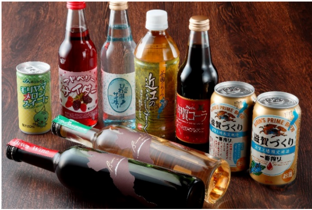
地元名産ドリンクをラインナップしたミニバー（※一部有料）