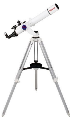
Vixen 天体望遠鏡 ポルタ II A80Mf

美しい名月を観望いただくため、株式会社ビクセンによる、天体望遠鏡、双眼鏡を設置。幻想的なガーデンで、秋の夜空を眺めるひとときを。