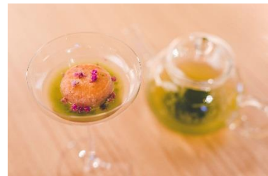
京漬物のサヴァラン

ドリップコーヒー、エスプレッソ、カフェラテ、和紅茶、和紅茶フレーバー、日本伝統茶、紅茶 など25種以上がお好きなだけ飲み放題