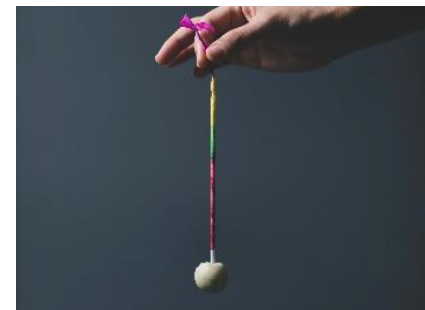
線香花火をモチーフにしたチョコレート 「パチパチパンチ」

シャンパーニュとお料理で心を満たした後は、フリーフロープランをご利用いただいた方へ特別に、線香花火をモチーフにしたひと口チョコレート「パチパチパンチ」をお土産としてご用意しております。イタリア料理「SCALAE」のシェフからのささやかなプレゼントです。「Champagne Night」の余韻に浸ってみてはいかがでしょうか。