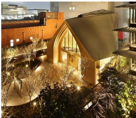
THE THOUSAND KYOTO 3 階に位置する「KOMOREBIDO (コモレビドウ)」

また、屋外のガーデンだけでなく、ホテル館内の吹き抜けに広がる 32 段の大階段でも、シャンパンを片手にお過ごしいただけます。その時の気分に合わせて、ゆったりとした時間の流れるガーデンや、ホテルを象徴する大階段で、心を満たす大人のひとときをお過ごしください。