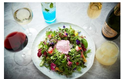
アパタイザー「菜園」 お 1 人様 1 皿ご提供

このアパタイザー「菜園」のほかに、イタリア料理「SCALAE」の“おとなの縁日”をテーマにした特別メニューもオーダーいただけます。（料金別途）