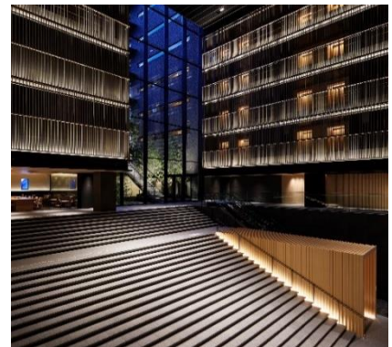
ホテルのシンボリック的存在「大階段」