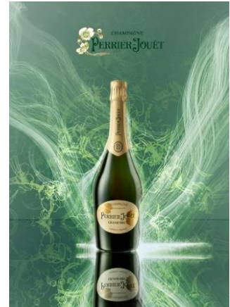
メゾン ペリエ ジュエの伝統を受け継ぐ 「ペリエ ジュエ グラン ブリュット」

その他、赤・白ワインやウイスキー、各種カクテル、ノンアルコールドリンクもフリーフロー内でお楽しみいただけます。中でも、縁日にちなんだ「ラムネ」や関西の夏の定番「冷やし飴」を使用したオリジナルカクテルは必見。グラスを傾けながら、気持ち華やくひとときをお過ごしください。