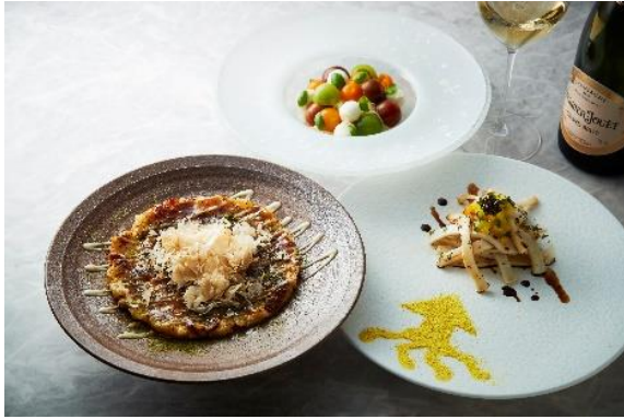
(手前左) フォンドボーとお好み焼きリゾット 1,300 円 (手前右) スカーラエのイカ焼き 1,200 円 (奥中央) トマティーナ 1,500 円

イタリア料理「SCALAE」では、「お祭り」や「縁日」をイメージした遊び心のある特別メニューをご用意いたしました。見た目が好み焼きそっくりなパルミジャーノチーズリゾット、イカ焼きを SCALAE 風アレンジしたアラカルトなどが登場。イタリア料理「SCALAE」の料理長・菱田の独創的なアイデアと革新的な技術がつまった一皿は、その見た目と味とのギャップに、思わず胸が躍ります。