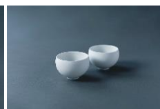
有田焼湯呑み 1,650 円/個