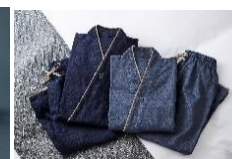
作務衣 8,800 円