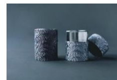
糸巻きお茶缶 4,400 円/個