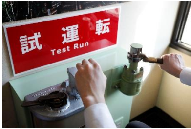
マスクン・ブレーキ