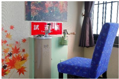
「きらら」仕様の椅子