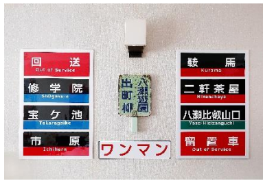
方向幕・行先方向板 ワンマン表示プレート