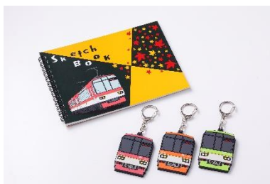
「きらら」ラバーキーホルダー 「マルマン×きらら」スケッチブック

■ 客室内に設置された展望列車「きらら」デザインのフォトブースで撮影ができます。