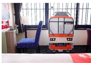
記念撮影用パネル