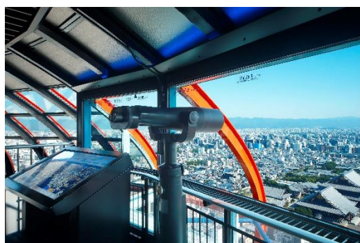
▲ 京都タワー展望室