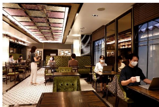
▲ コワーキングスペース「レジーナ」

無料の望遠鏡が設置された地上 100 メートルの 展望室から、京都の眺望をお楽しみいただけます。 ※ご宿泊日数に限らず、お一人さま 1 枚のお渡しです。