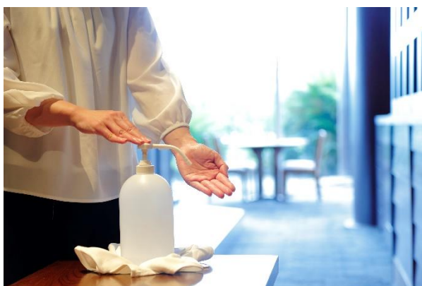
感染対策イメージ