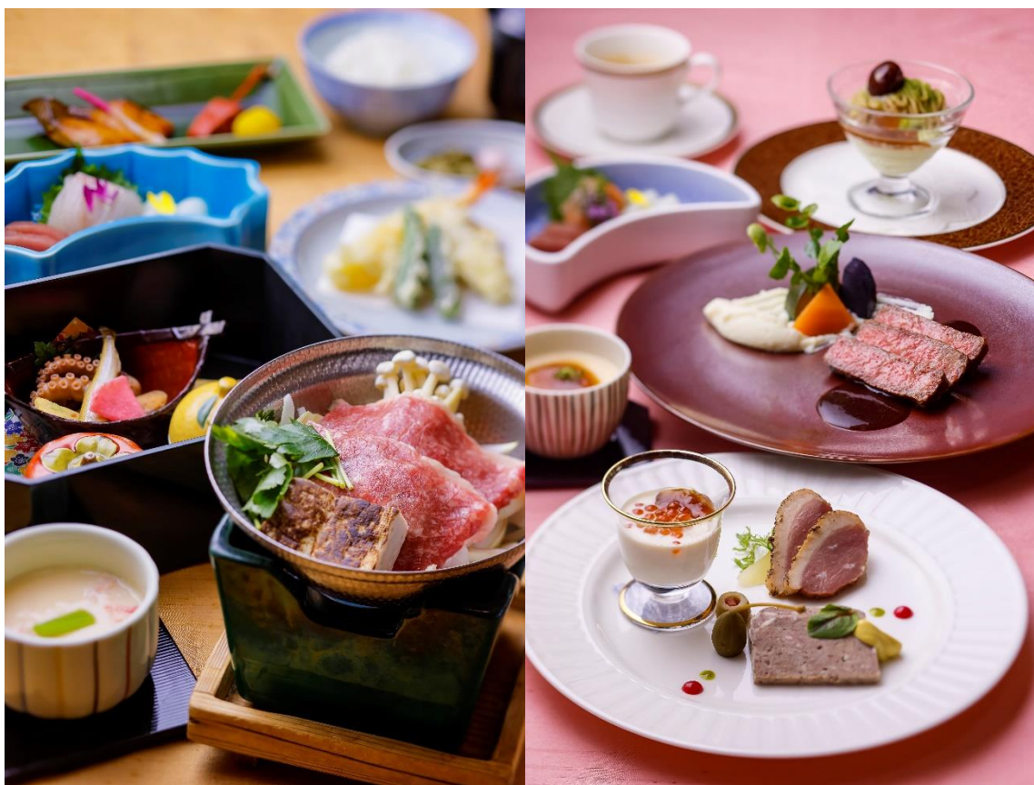
忘新年会プラン料理（イメージ）

琵琶湖ホテル（所在地：滋賀県大津市浜町、総支配人：前田義和）では、2021年12月1日（水）から2022年2月28日（月）まで、宴会場で利用できる忘新年会プランを販売しています。一年の出来事を振り返る忘年会に、新たな年のスタートを祝う新年会。ご家族ご親戚、職場の仲間と集まる機会も徐々に増えてきました。安全・安心を守る感染対策はもちろん、美味しい料理で宴を存分に楽しんでいただきたいとの思いから、今年は和洋折衷コースを中心に4つのプランをご用意。ご希望の料理スタイルやご予算に合わせてお選びいただけます。