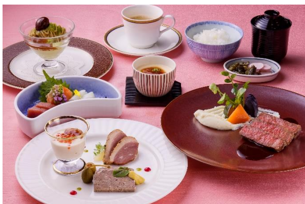
和洋折衷料理 12,000 円プラン (イメージ)