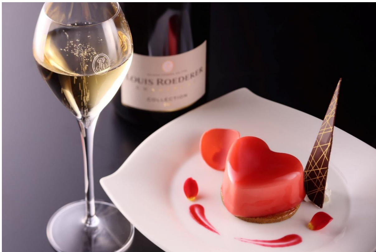
アドベリーのチーズムース（イメージ）

琵琶湖ホテル（所在地：滋賀県大津市浜町、総支配人：前田義和）は、2022年2月1日（火）から2月28日（月）の1ヶ月間、スイートルーム、プレミア・ラグジュアリーフロア「Vista」およびプレミア・ラグジュアリーフロア「Aqua」から成るクラブフロアにご宿泊のお客様専用のクラブラウンジにて、2月限定のバレンタインデザートをティータイムにご提供します。ルイ・ロデールの新作シャンパン〈コレクション 242〉とともに、大切な方と素敵な時間をお過ごしください。