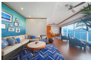
ロイヤルスイートルーム 100 m 2