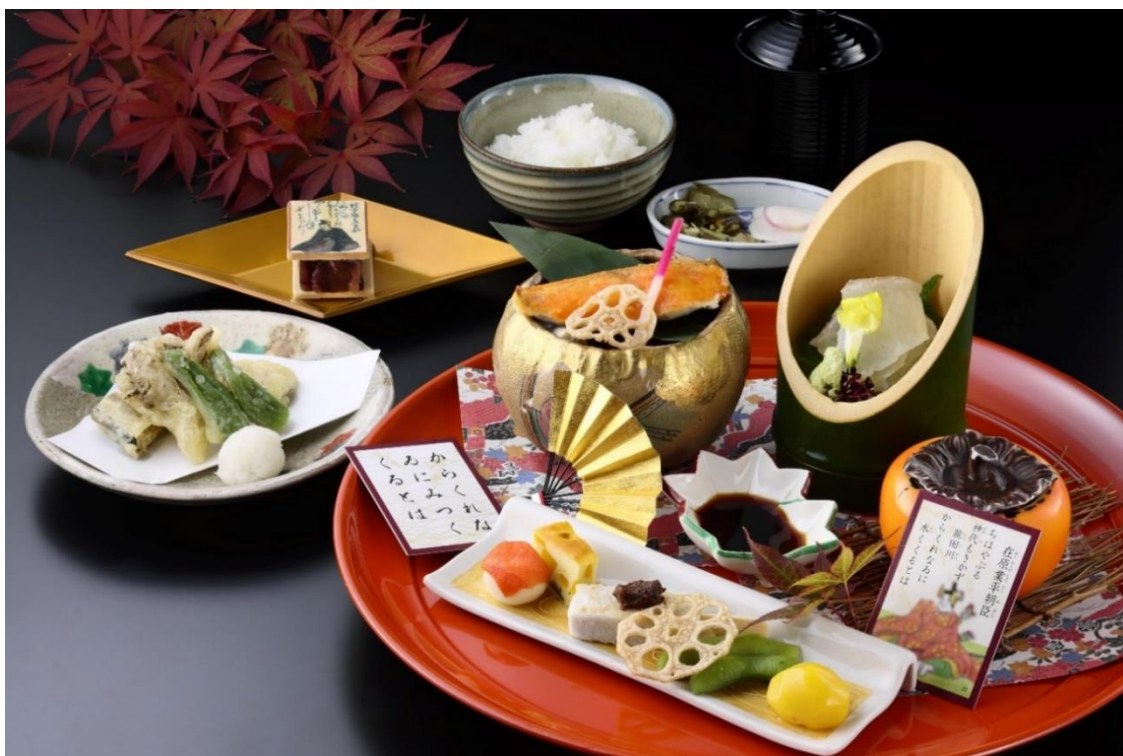
「日本料理 おおみ」百人一首ランチ 秋の宴（イメージ）

琵琶湖ホテル（所在地：滋賀県大津市浜町、総支配人：前田義和）は、2022年9月5日（月）から12月4日（日）までの期間、2階「日本料理 おおみ」にて『百人一首ランチ 秋の宴』を、また、「バー ベルラーゴ」で『百人一首カクテル』第18弾となる新作オリジナルカクテル2点を販売します。