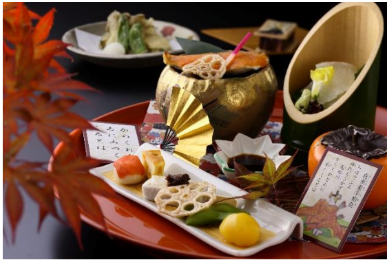
百人一首ランチ 秋の宴 (イメージ)

「日本料理 おおみ」の料理長が遊び心あふれる献立と色とりどりの盛り付けで百人一首の歌の世界を表現する四季替わりの『百人一首ランチ』。