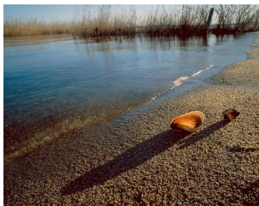
【砂浜に打ち上げられたカラスガイ】