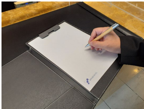
取り組み例 筆談用具の設置

「心のバリアフリー」に関する取り組みとして、車いすの貸し出し（3台）、車いす対応客室の設置、障がい者用駐車スペースの確保、共有部建物入り口の段差の解消、筆談用具の設置、エレベーター内の操作盤の点字表示など施設面での対応のほか、社員研修等を通して「心のバリアフリー」に対するサービススタッフの意識とスキル向上に努めています。