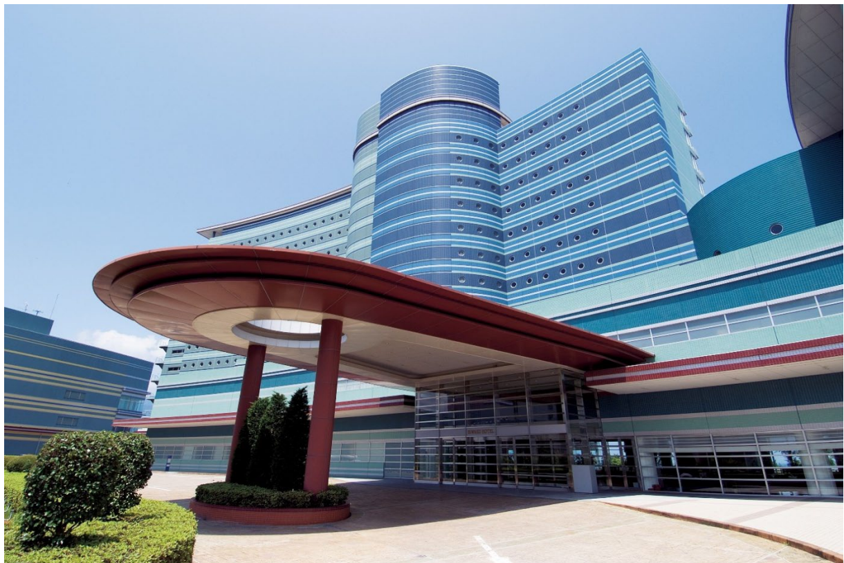
琵琶湖ホテル外観

琵琶湖ホテルでは、これからも訪れてくださるすべての皆様に安全で快適にお過ごしいただけるよう取り組みを進めてまいります。