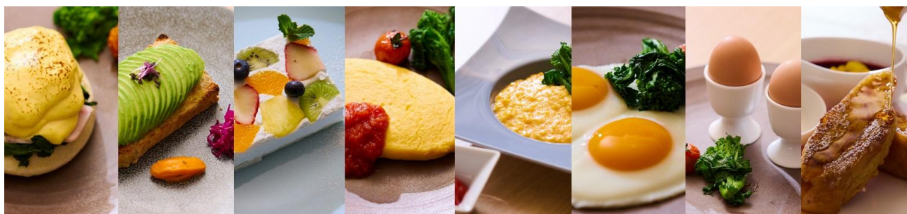
※メインディッシュ イメージ

※表示価格には、サービス料 13%と消費税が含まれております。 ※メニュー内容および食材の産地等は仕入れの都合により変更になる場合がございます。 ※営業時間等は予告なく変更になる場合がございます。詳しくは公式 HP をご確認ください。 ※写真は全てイメージです。