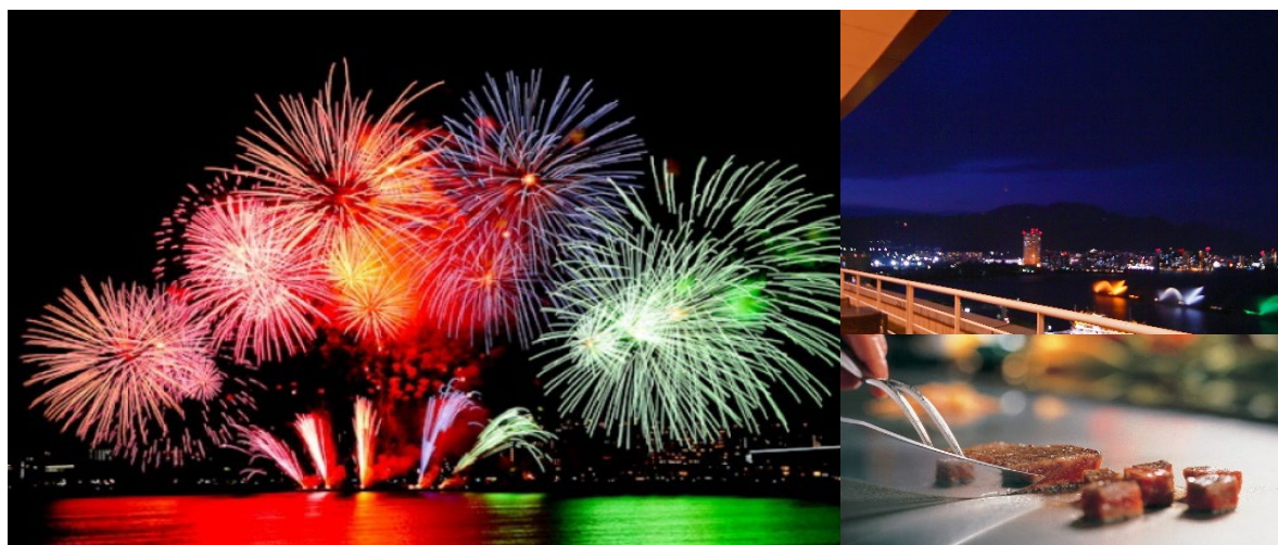
「びわ湖大花火大会」イメージ

滋賀県が誇る夏の風物詩、「びわ湖大花火大会」。新型コロナウイルス感染症の影響により、2019年以来開催を見送られていましたが、今年、4年ぶりに開催が決定しました。県内最大規模の花火の打ち上げ会場となる大津港沖は、琵琶湖ホテルのすぐ目の前。真夏の夜空に浮かび上がる大迫力の花火を客室のプライベート空間でくつろぎながら楽しめる宿泊プランや、湖上の景色を見渡せる13階屋上の特別観覧席からの花火観賞とレストランのお食事がセットになったプラン等をご用意しております。琵琶湖を舞台に繰り広げられる約1万発の花火を、ロケーション抜群の特等席でお楽しみください。