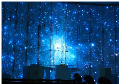
チャペル演出イメージ

食事の後は、いよいよプロポーズ。「チャペルでプロポーズプラン」では、スタッフがさりげなくお二人を静かな夜のチャペルにいざないます。ご希望によりオプションでミナラキャンドルや、壁全体 360 度を包み込む圧巻のプロジェクトンマッピングによる映像演出も可能です。「宿泊ルームでプロポーズ」プランでは、ベッドをバラでデコレーション。まるで映画のワンシーンのような、一生の思い出となる大切なひとときを盛り上げます。