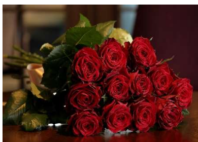
ダズンローズイメージ

本プランでは、プロポーズの演出として「ダズンローズ」をご用意。「ダズン」＝「12」のバラは、「感謝、誠実、幸福、信頼、希望、愛情、情熱、真実、尊敬、栄光、努力、永遠」を表し、12本のバラを贈ることで、その全てをパートナーに誓うという意味が込められています。オプションで「永遠（とわ）」を意味する 108本のバラのご用意も可能です。