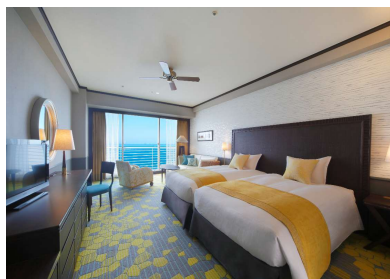
客室 Lumina イメージ

プロポーズの後は、スタッフがお部屋にケーキをお届けします。幸せの余韻にゆっくりと包まれるひとときをお過ごしください。ご宿泊のお部屋は「光・輝き・煌めき」をイメージしたデラックスフロアの「Lumina」をご用意。目覚めると、きらきらと輝く雄大な琵琶湖がお二人を祝福してくれることでしょう。チェックアウトの際に「ハレの日コンシェルジュ」より記念に「プロポーズ証明書」をプレゼントいたします。