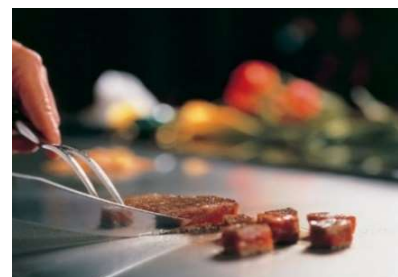
ディナーイメージ