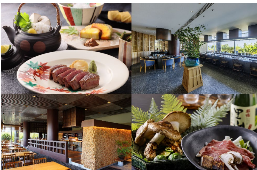
琵琶湖ホテル 秋のランチイメージ

「日本料理 おおみ」では、毎年人気のメニュー「松茸と近江牛すきやきランチ」が今年も登場。「鉄板焼 おおみ」では、香り豊かな松茸の土瓶蒸しや牛フィレ肉が楽しめるランチ『晴嵐（せいらん）』をご用意しました。“爽りの秋”を感じる季節限定メニューをぜひお楽しみください。