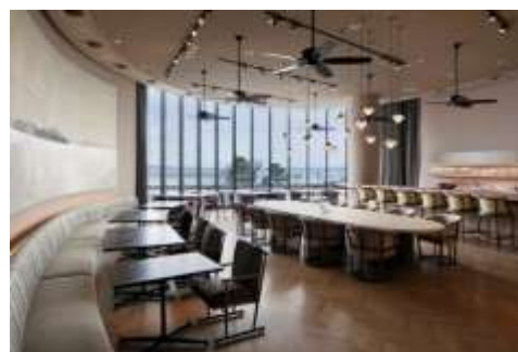
「クラブラウンジ」店内