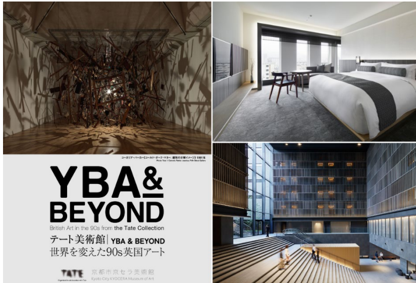
(左) メインビジュアル (右上) ザ・サウザンド京都 スーペリアダブルルーム (右下) ザ・サウザンド京都 大階段